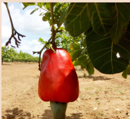
Pedúnculo de coloração vermelha

Clone recomendado para o cultivo em sequeiro, com adaptação às regiões litorâneas e semiáridas de baixa altitude (menos de 300 m). Recomendado para o mercado de amêndoas, polpas e sucos e eventualmente também é utilizado no mercado de mesa (feiras e supermercados).